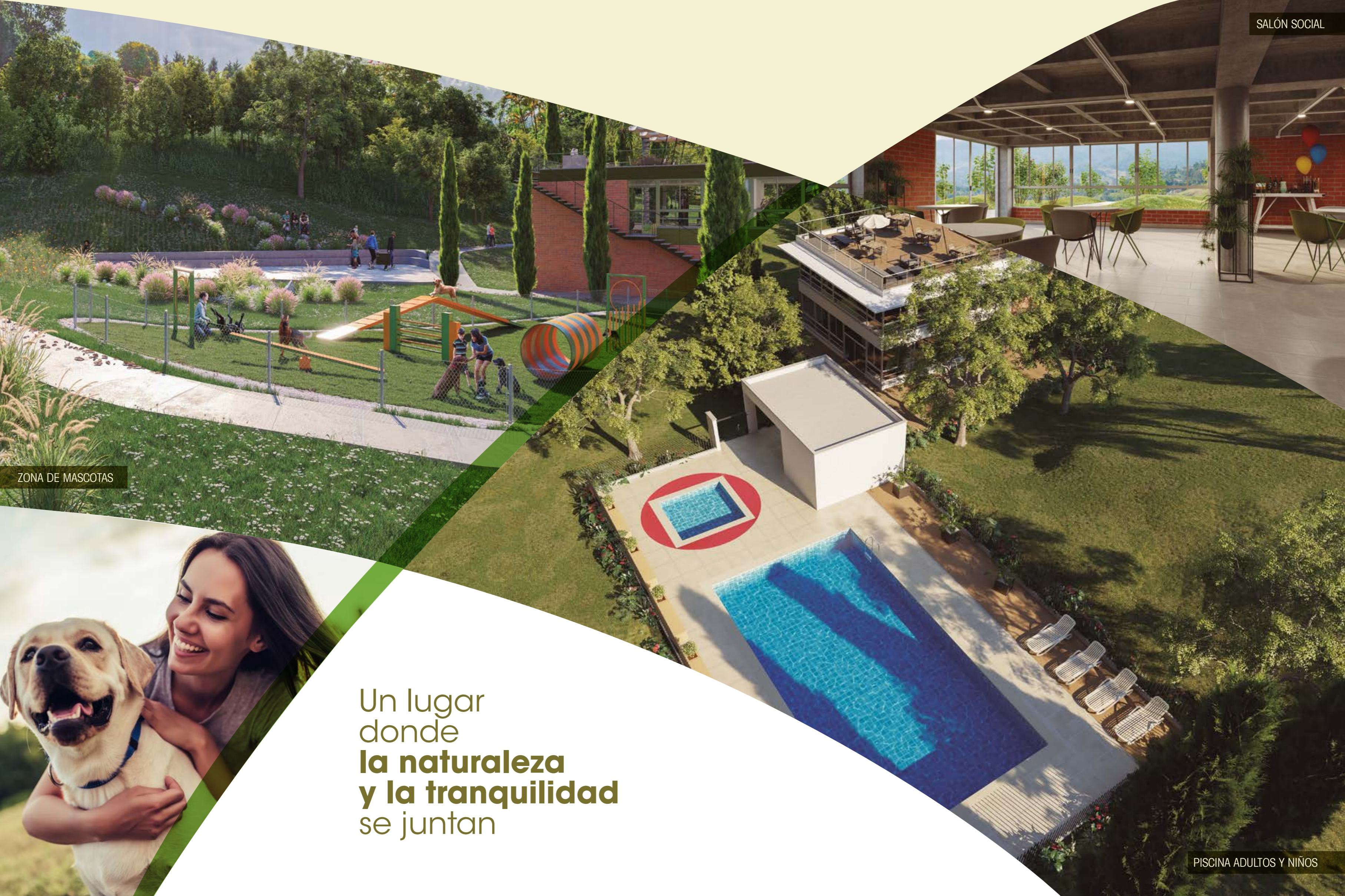
ZONA DE MASCOTAS