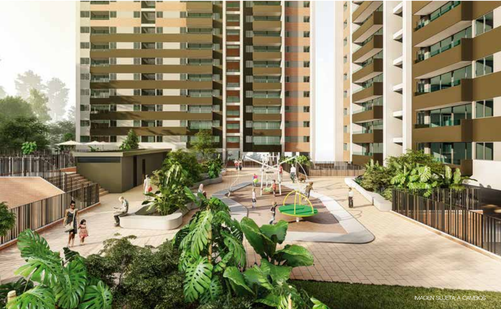
IMAGEN SUJETA A CAMBIOS