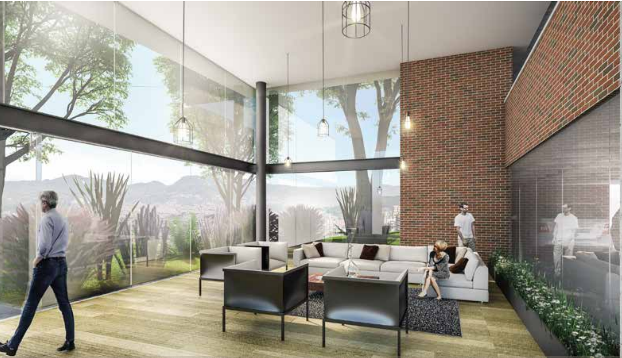
IMAGEN SUJETA A CAMBIOS - No incluye amoblamiento