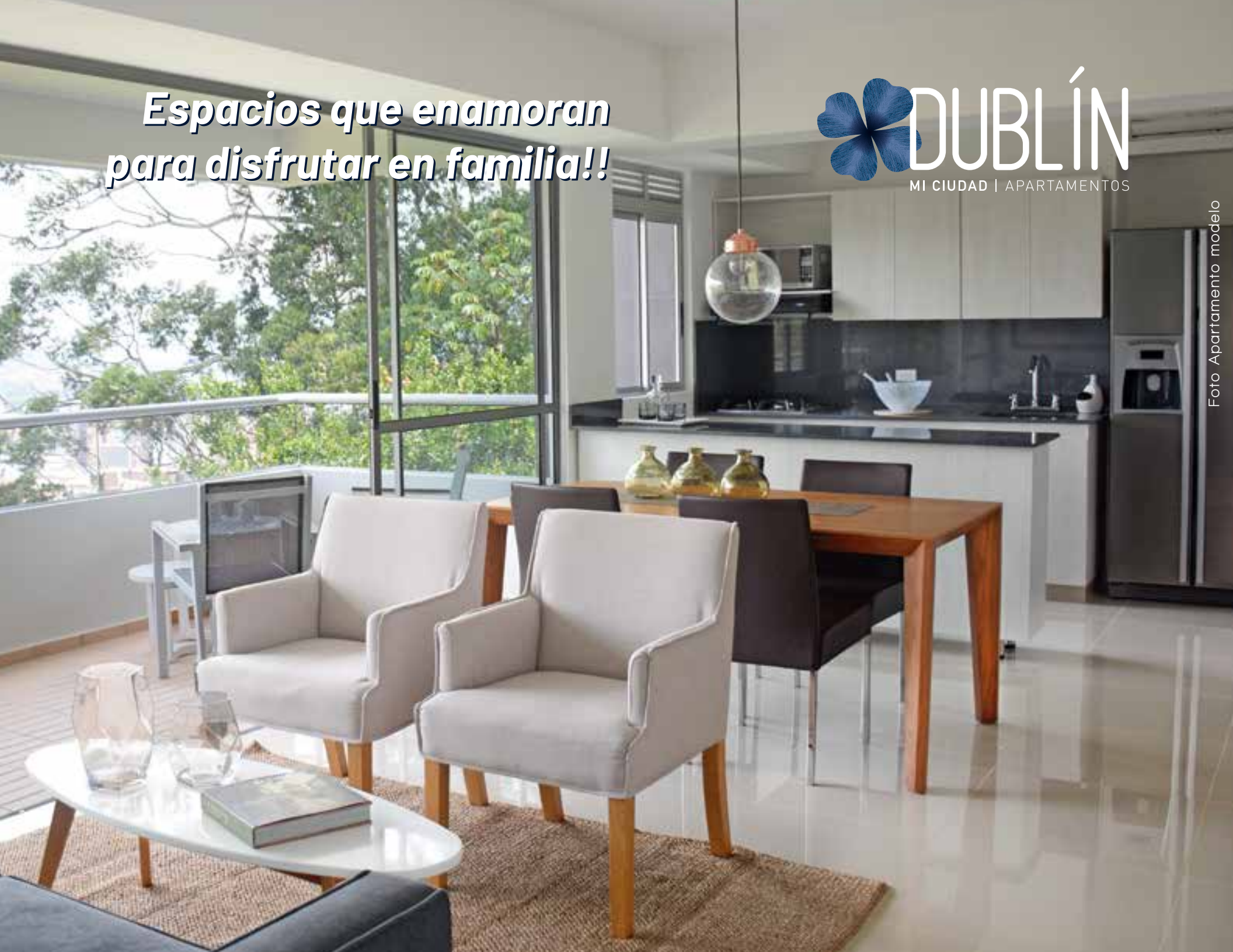
Foto Apartamento modelo