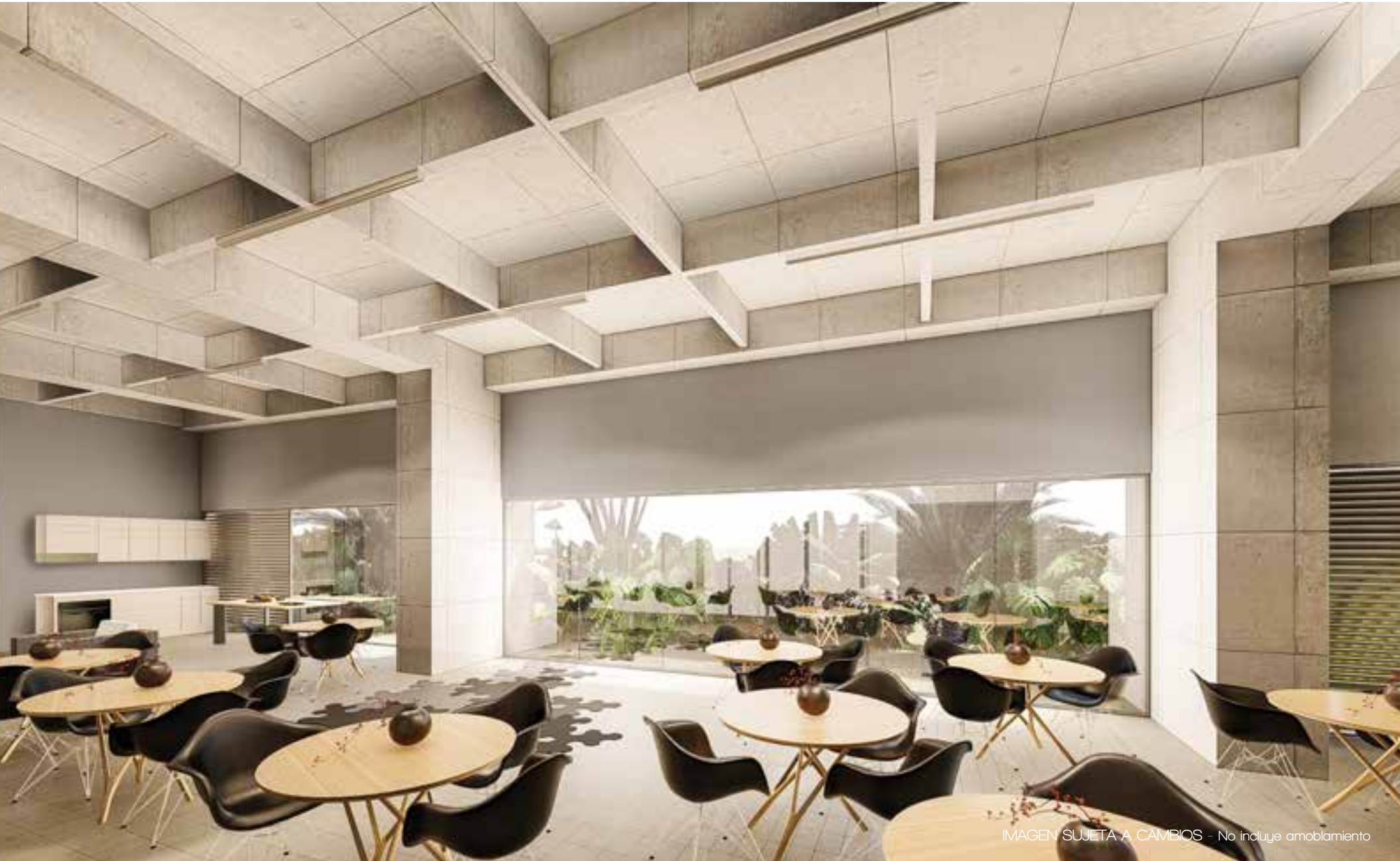
IMAGEN SUJETA A CAMBIOS - No incluye amoblamiento