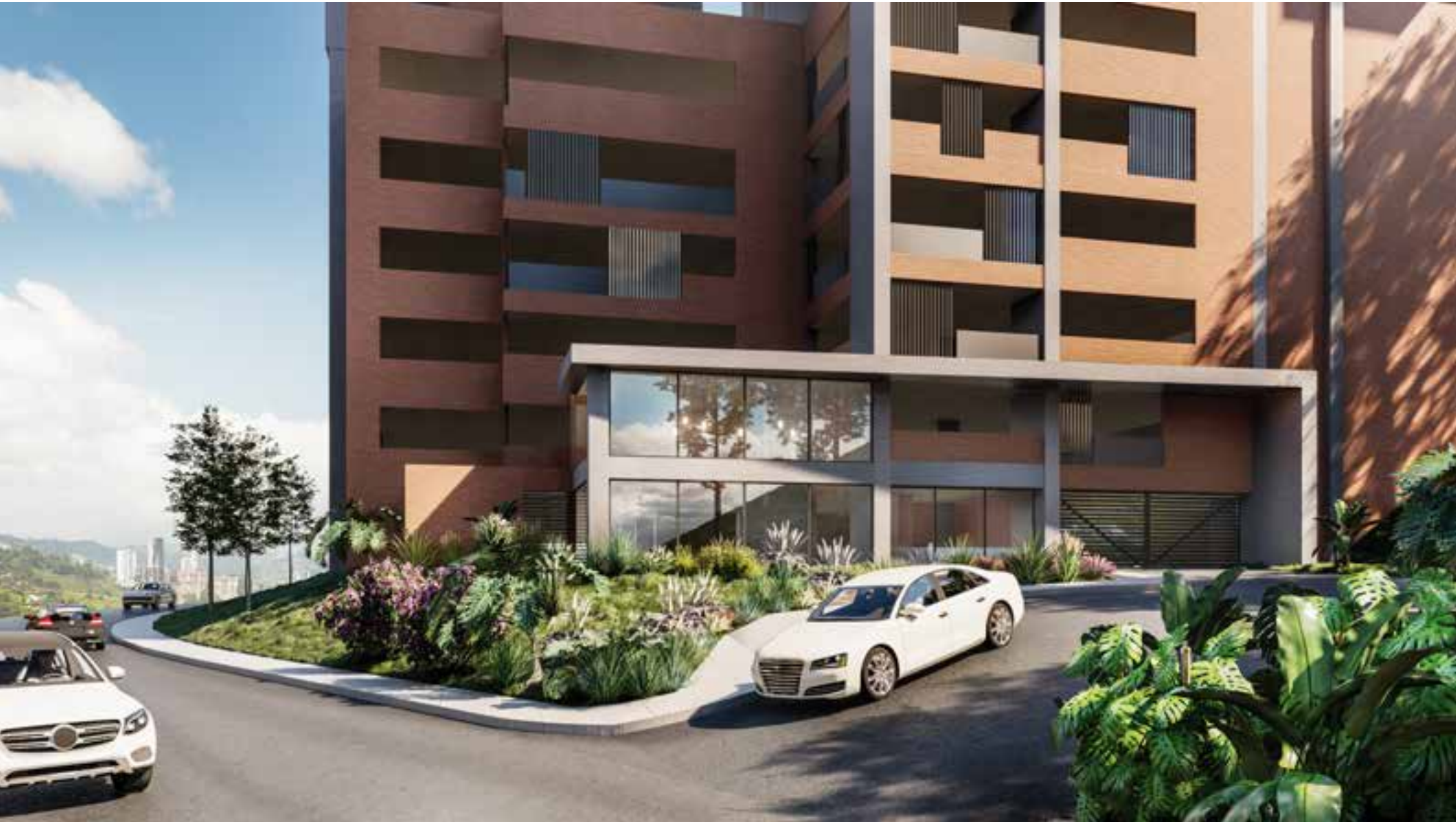
IMAGEN SUJETA A CAMBIOS