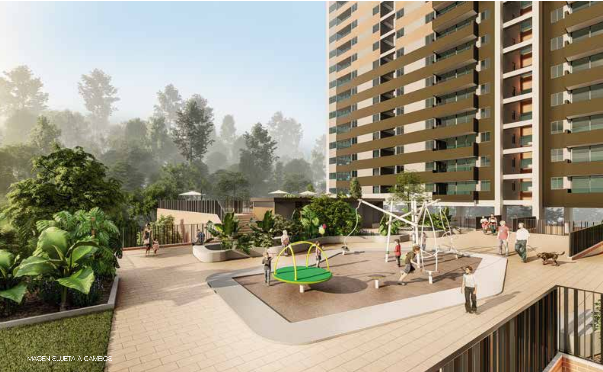
IMAGEN SUJETA A CAMBIOS