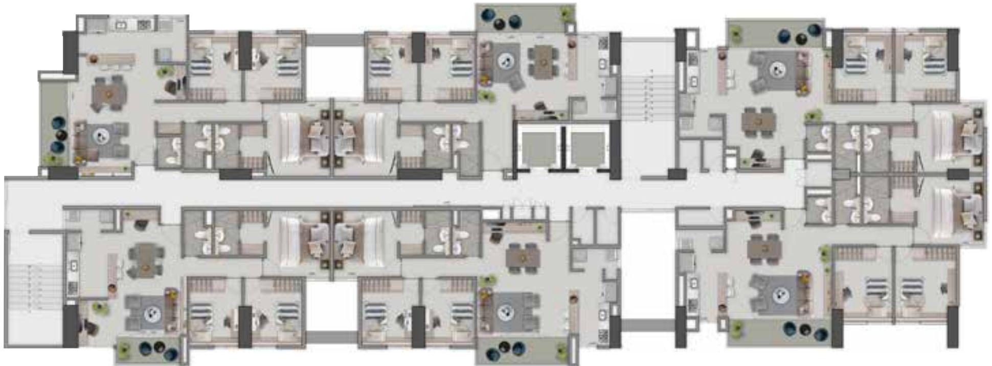
APTO TIPO D 81.36 M 2