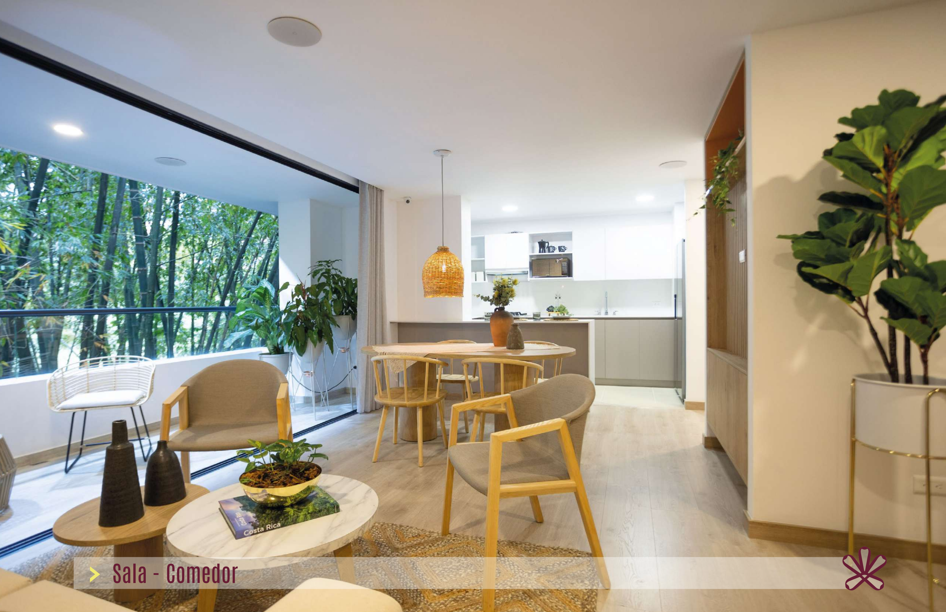
> Sala - Comedor