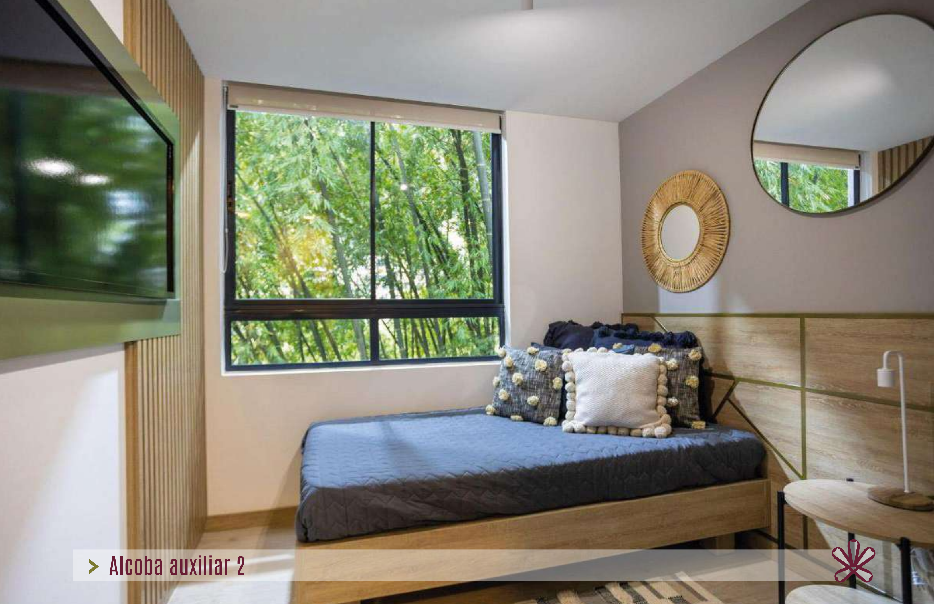
➤ Alcobá auxiliar 2