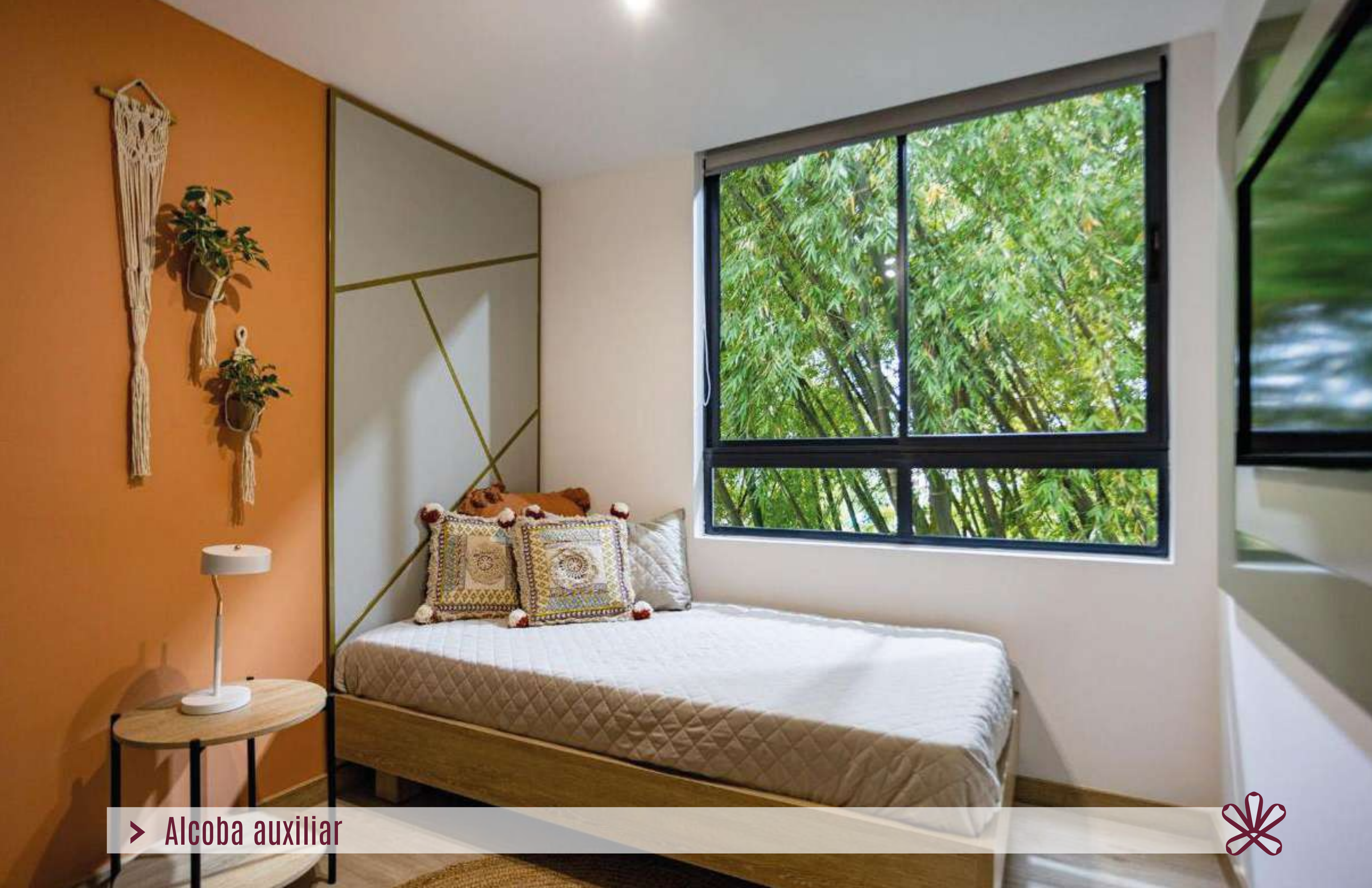
> Alcoba auxiliar