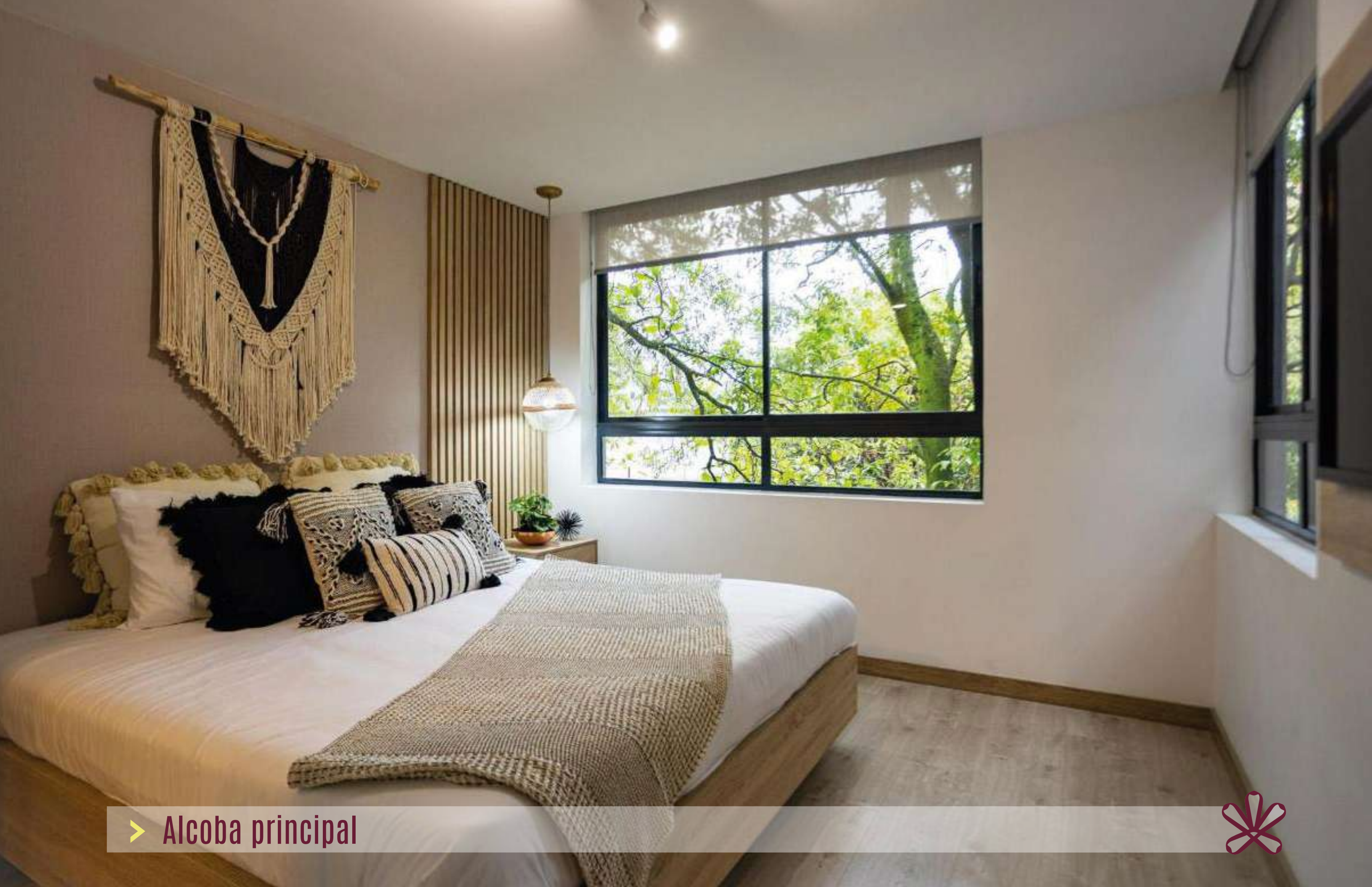
> Alcoba principal