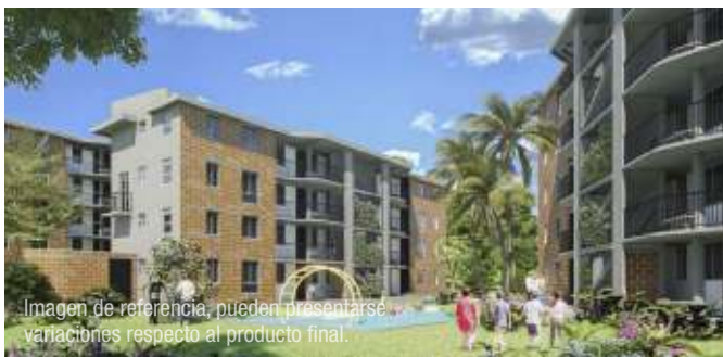
Imagen de referencia, pueden presentarse variaciones respecto al producto final.