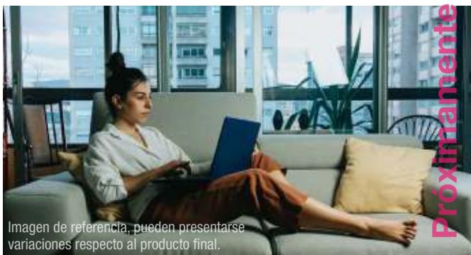
Imagen de referencia, pueden presentarse variaciones respecto al producto final.