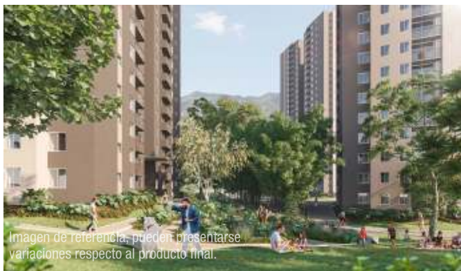
Imagen de referencia, pueden presentarse variaciones respecto al producto final.