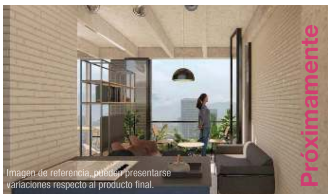
Imagen de referencia, pueden presentarse variaciones respecto al producto final.