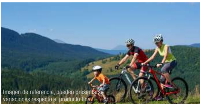
Imagen de referencia, pueden presentarse variaciones respecto al producto final.