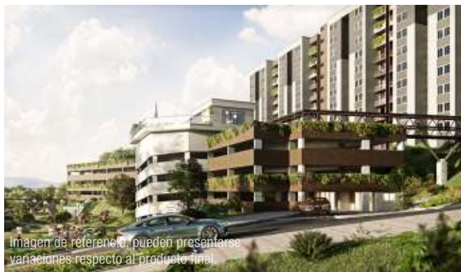
Imagen de referencia, pueden presentarse variaciones respecto al producto final.

Ofrecemos convenios comerciales que desarrollamos con empresas constructoras encaminados en cumplir tu sueño de acceder a una vivienda propia.