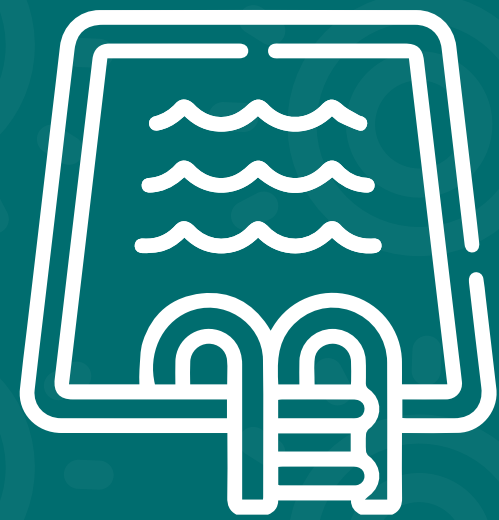
Piscina para adultos y niños