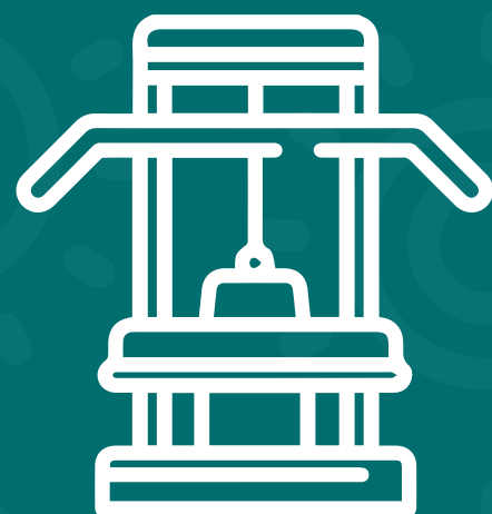
Gimnasio semidotado estilo crossfit cubierto