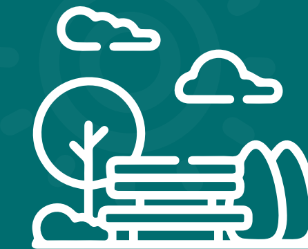
Parques Gimnasio + BBQ+ Juegos infantiles

Zonas comunes de uso exclusivo de los copropietarios