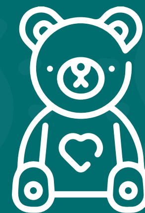
Espacio para futura guardería