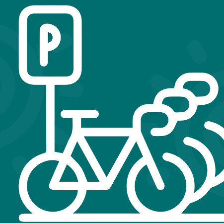
Parqueadero de Bicicletas