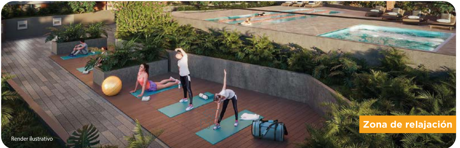
Zona de relajación