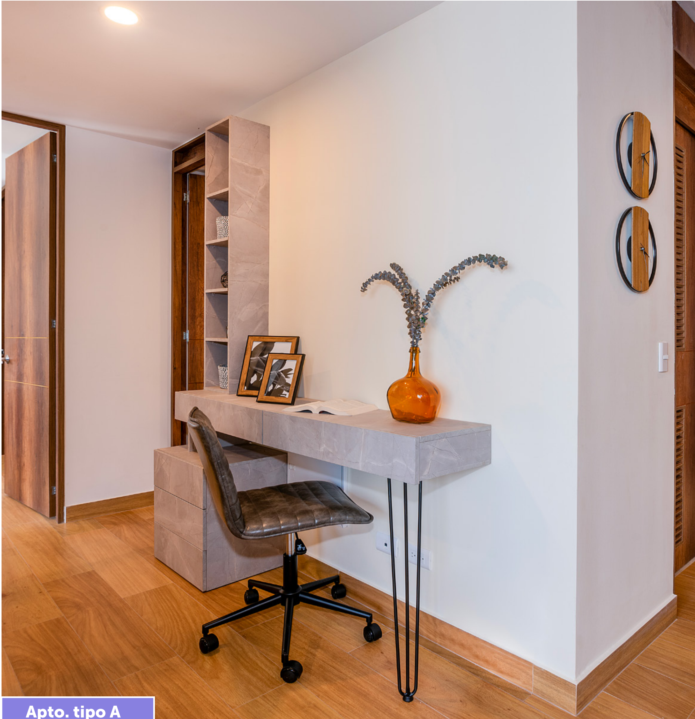
Apto. tipo A