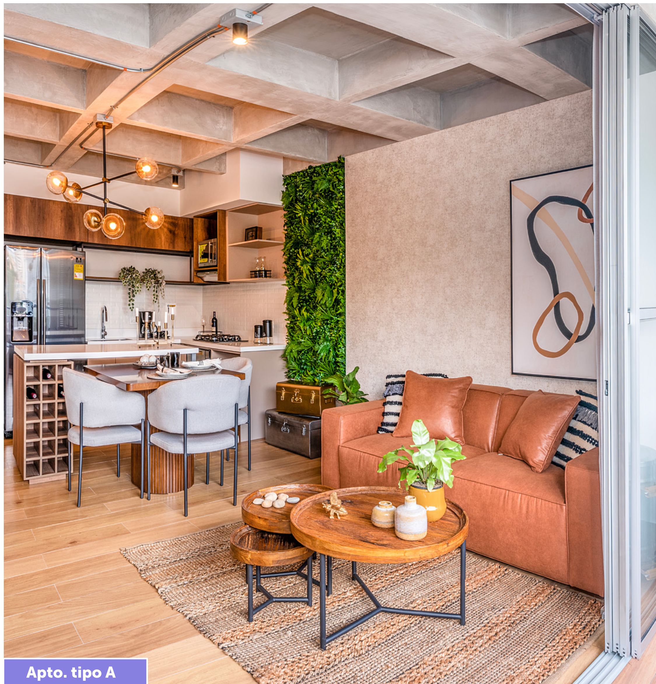
Apto. tipo A