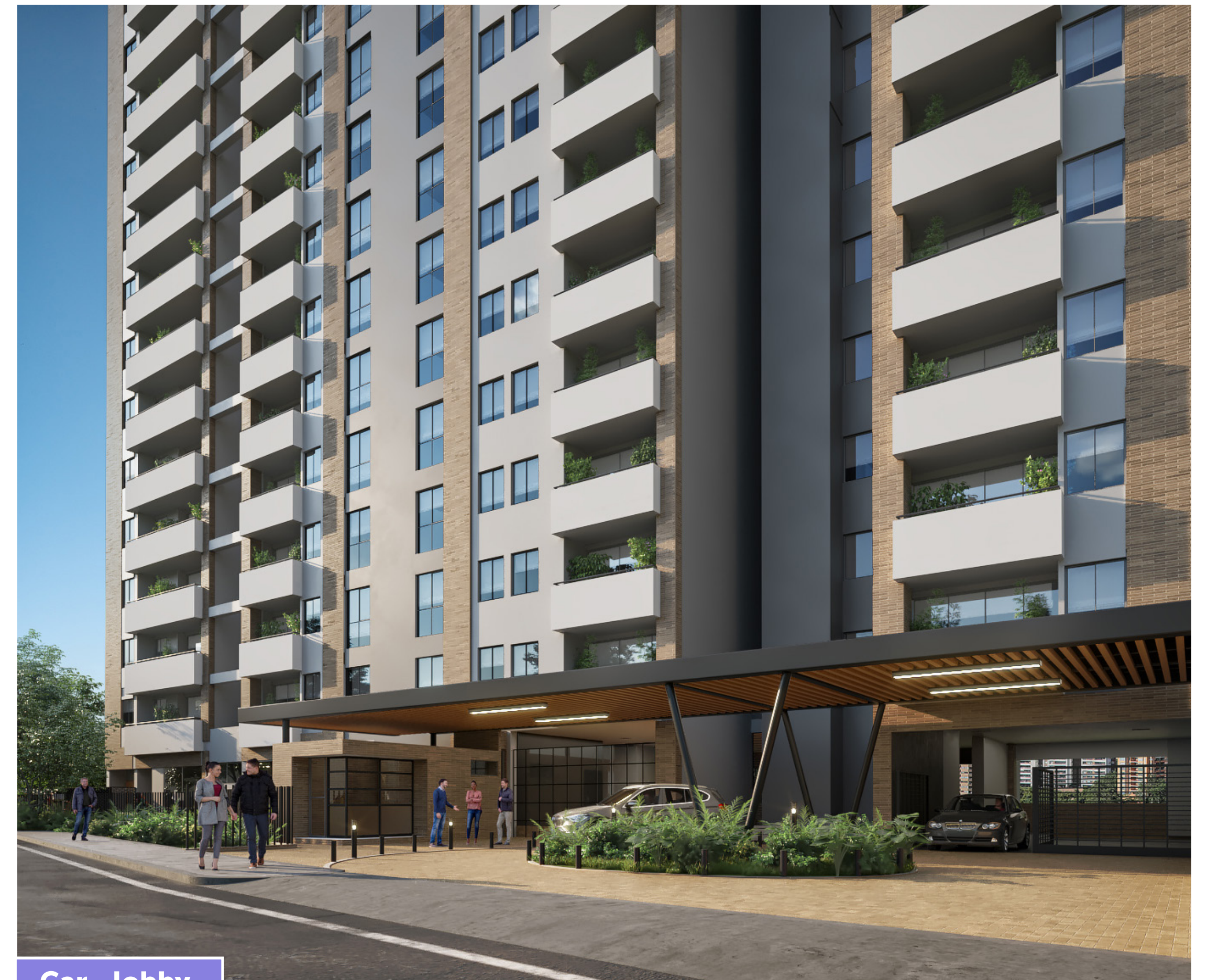
Car - lobby