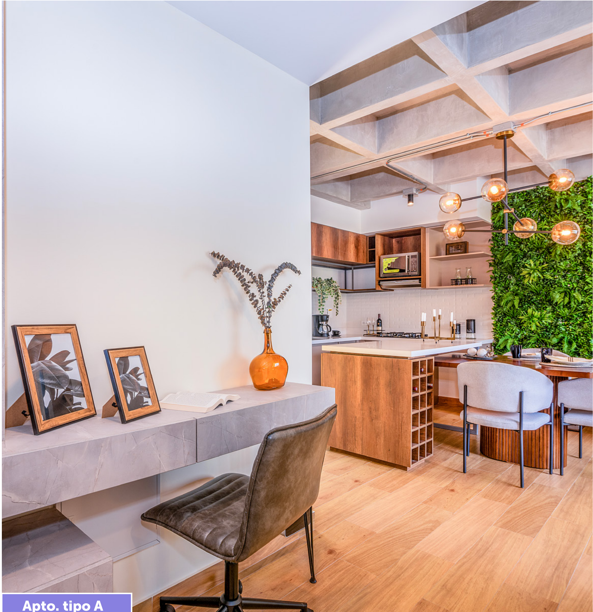
Apto. tipo A

Imagen de referencia, mobiliario es parte de decoración y no hace parte de la oferta comercial.