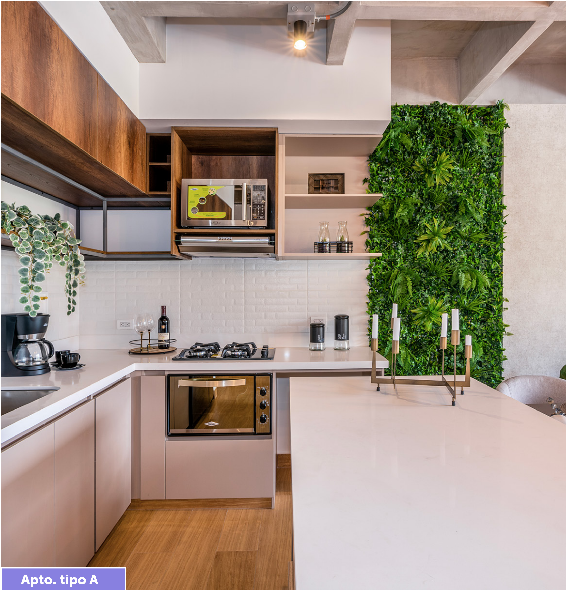
Apto. tipo A