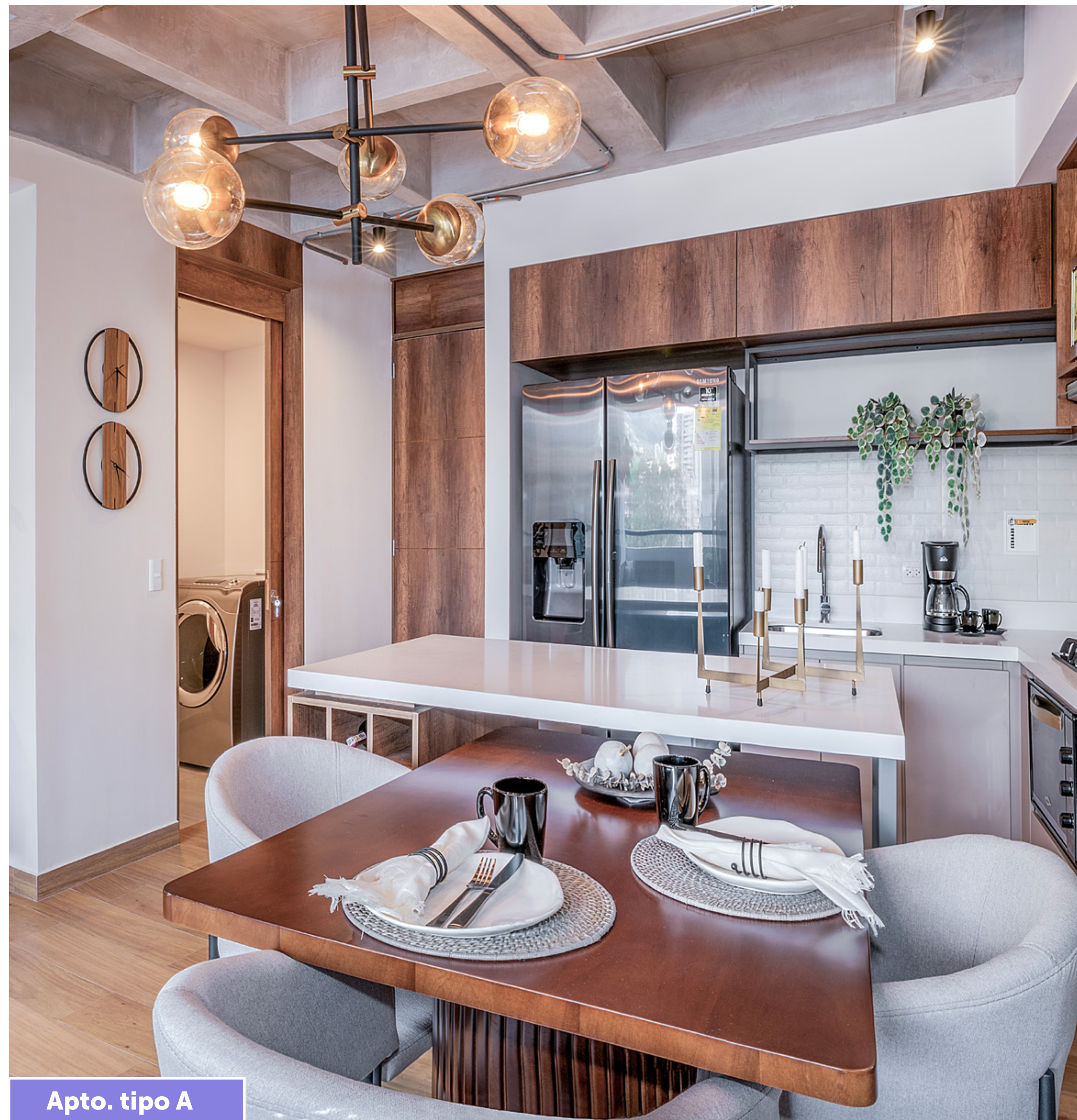
Apto. tipo A

Imagen de referencia, mobiliario es parte de decoración y no hace parte de la oferta comercial.