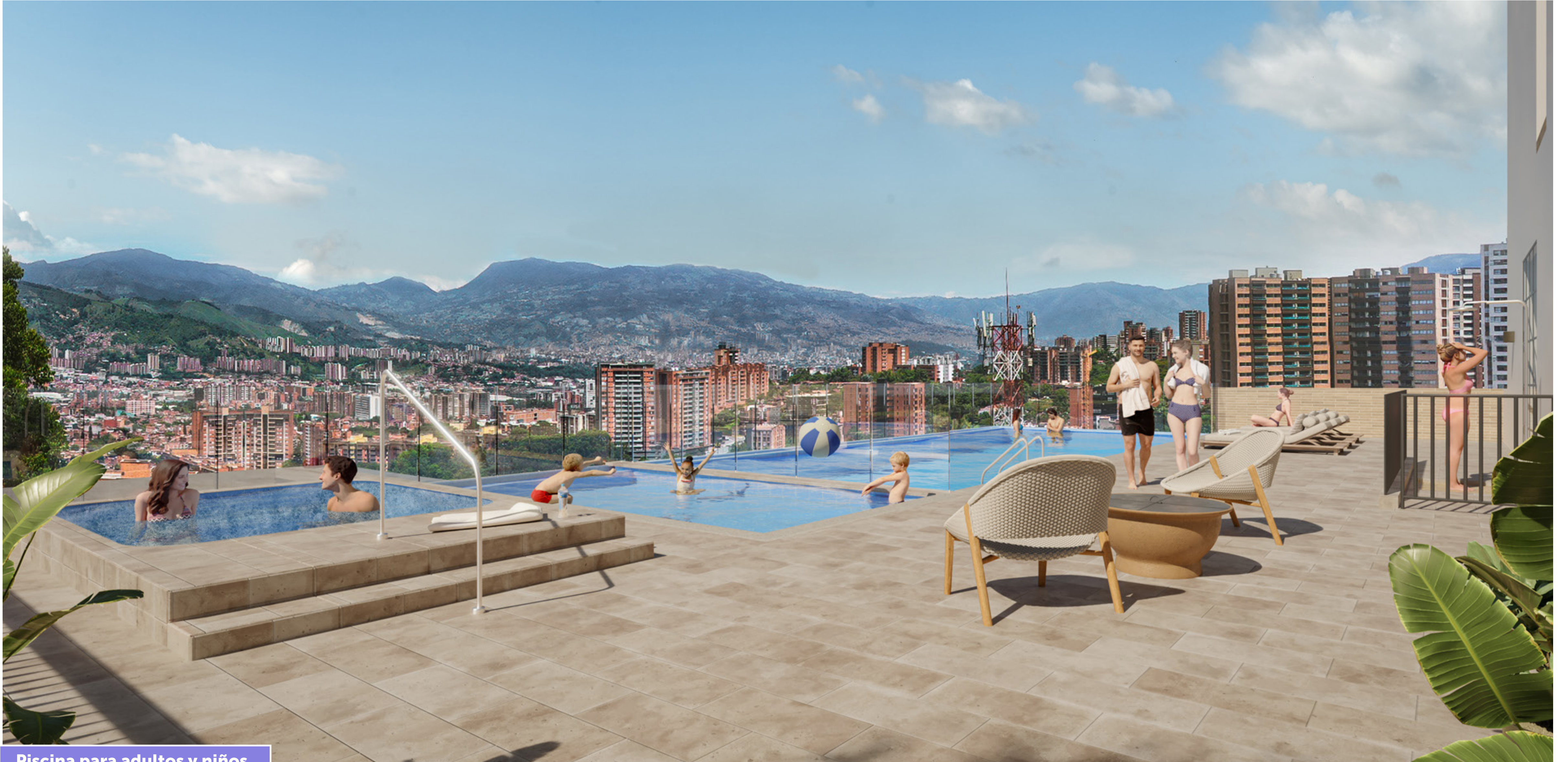
Piscina para adultos y niños