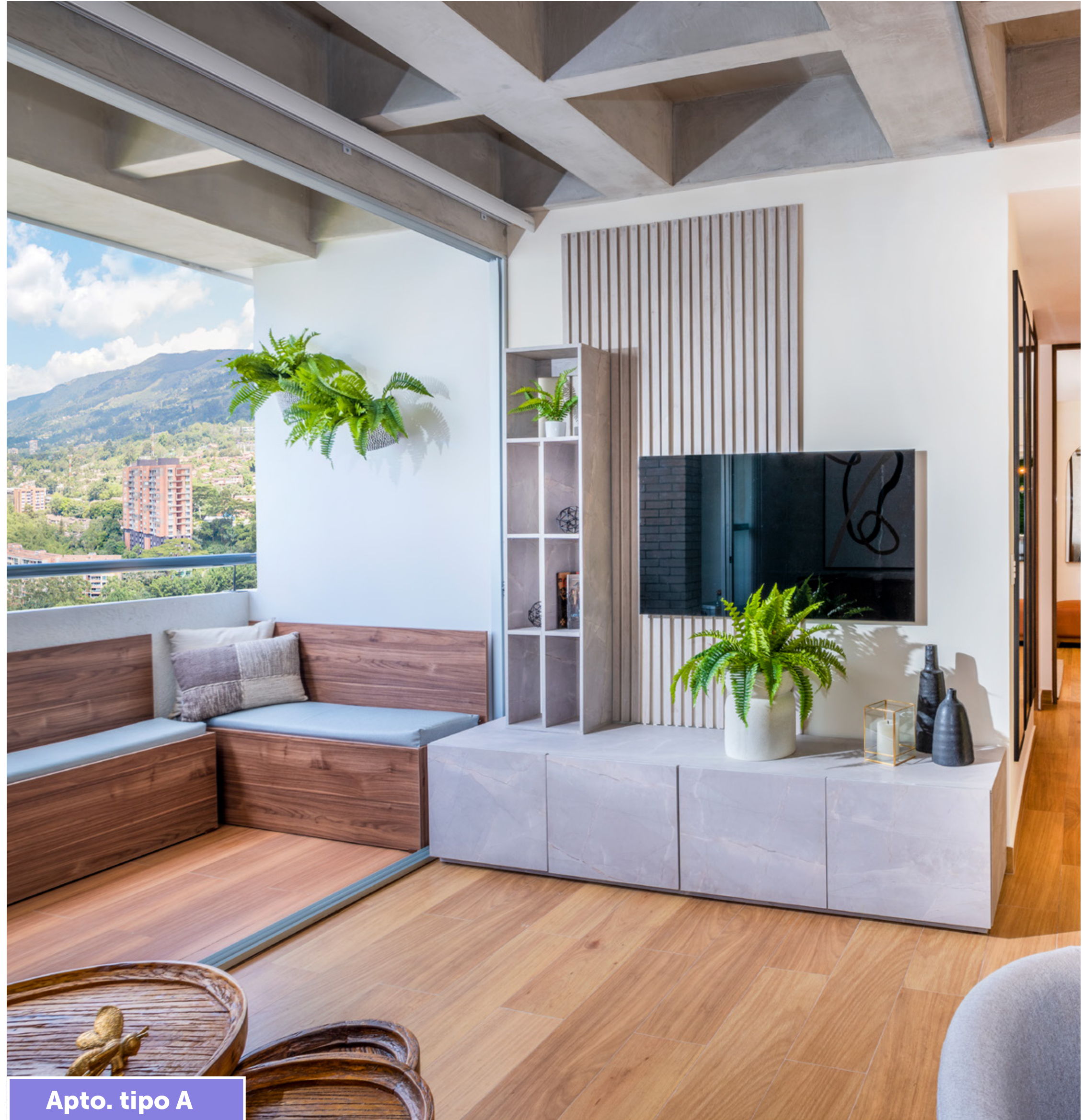
Apto. tipo A

Imagen de referencia, mobiliario es parte de decoración y no hace parte de la oferta comercial.