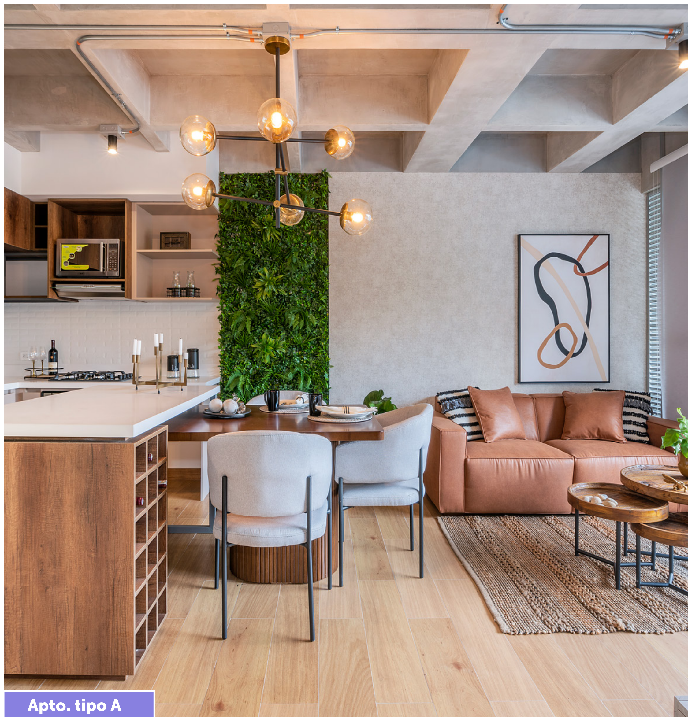
Apto. tipo A