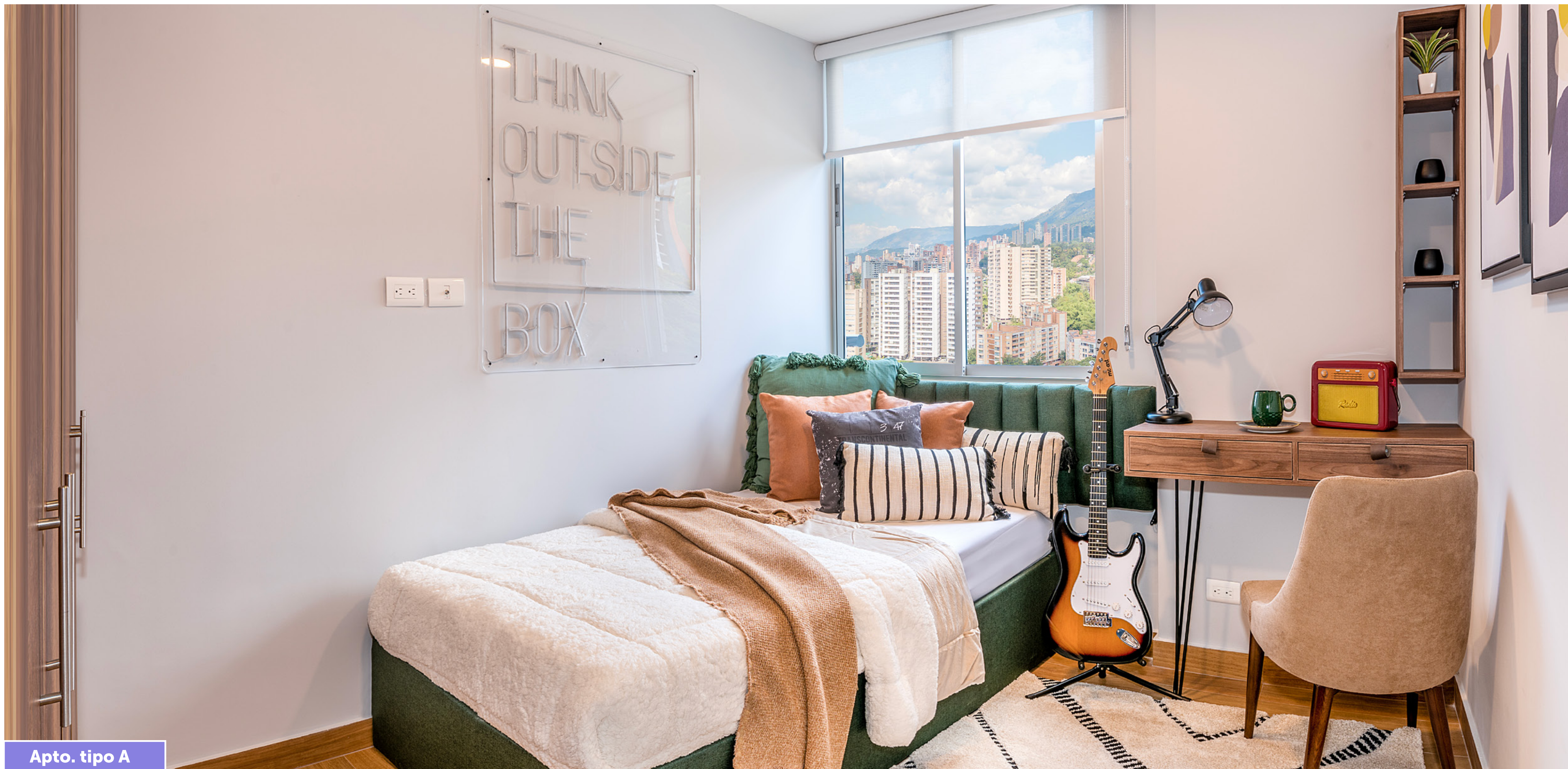
Apto. tipo A