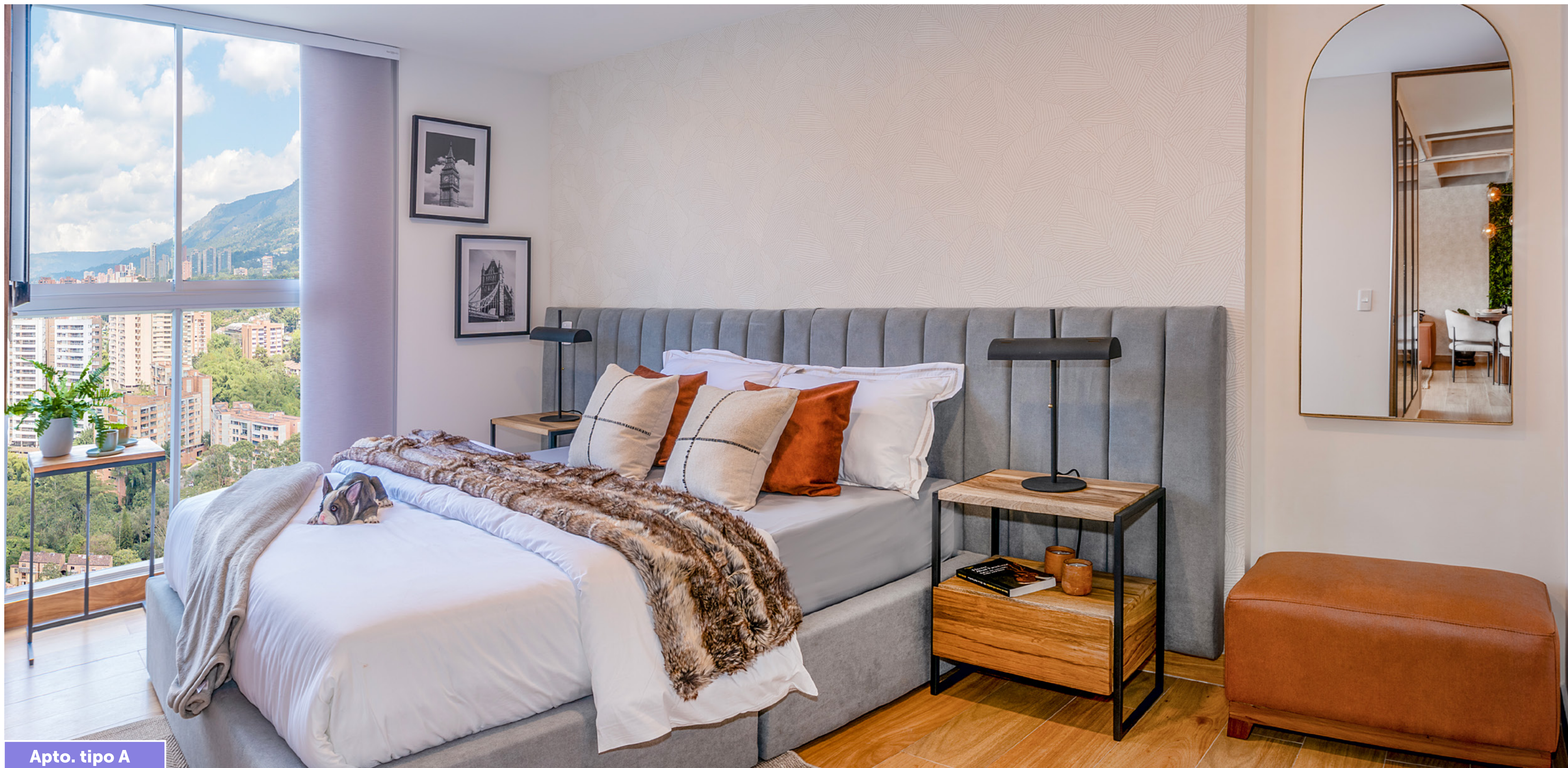
Apto. tipo A