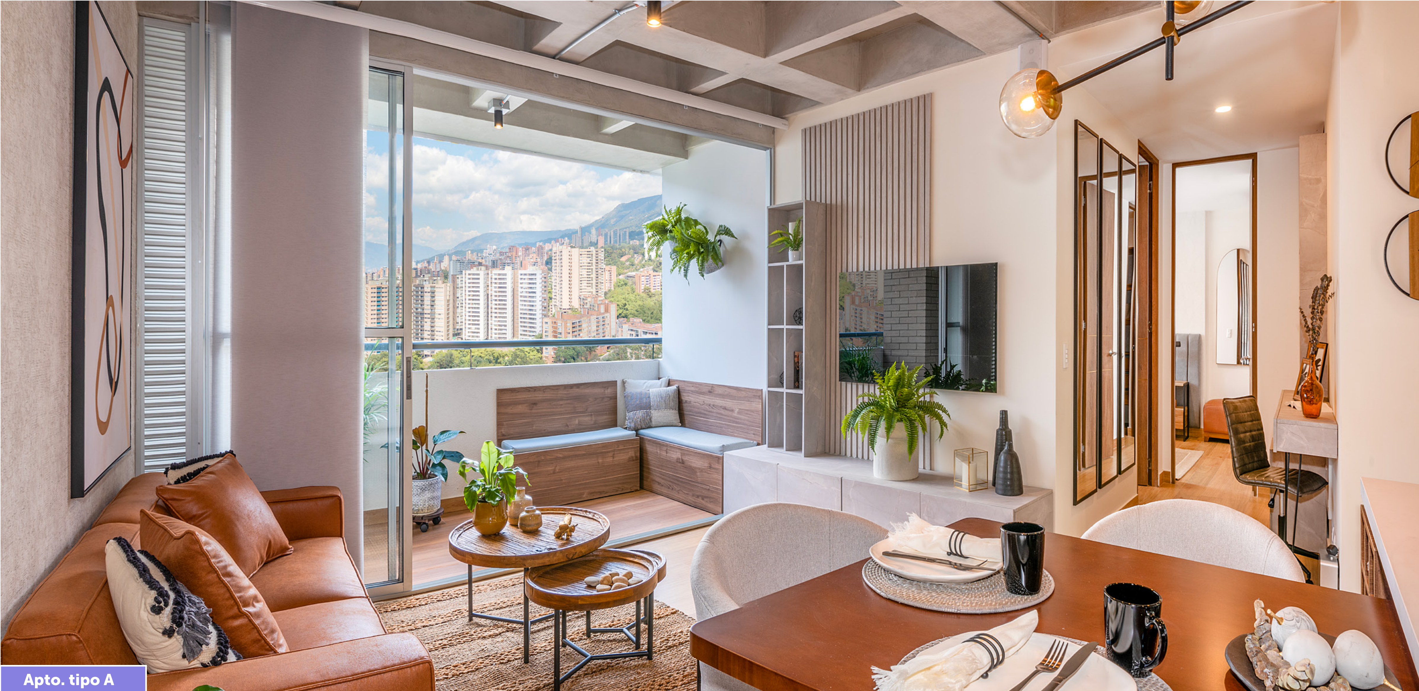
Apto. tipo A