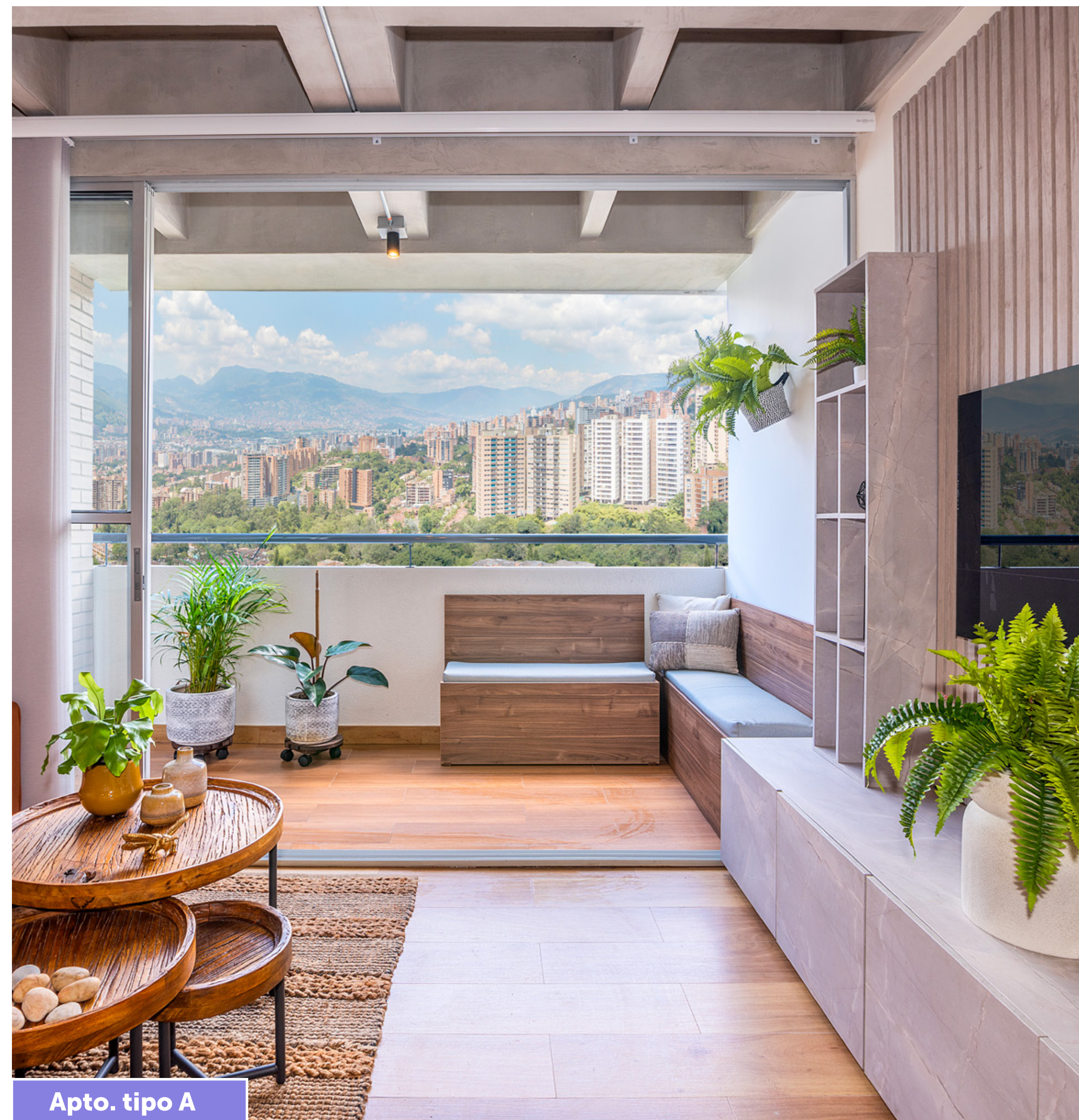
Apto. tipo A

Imagen de referencia, mobiliario es parte de decoración y no hace parte de la oferta comercial.