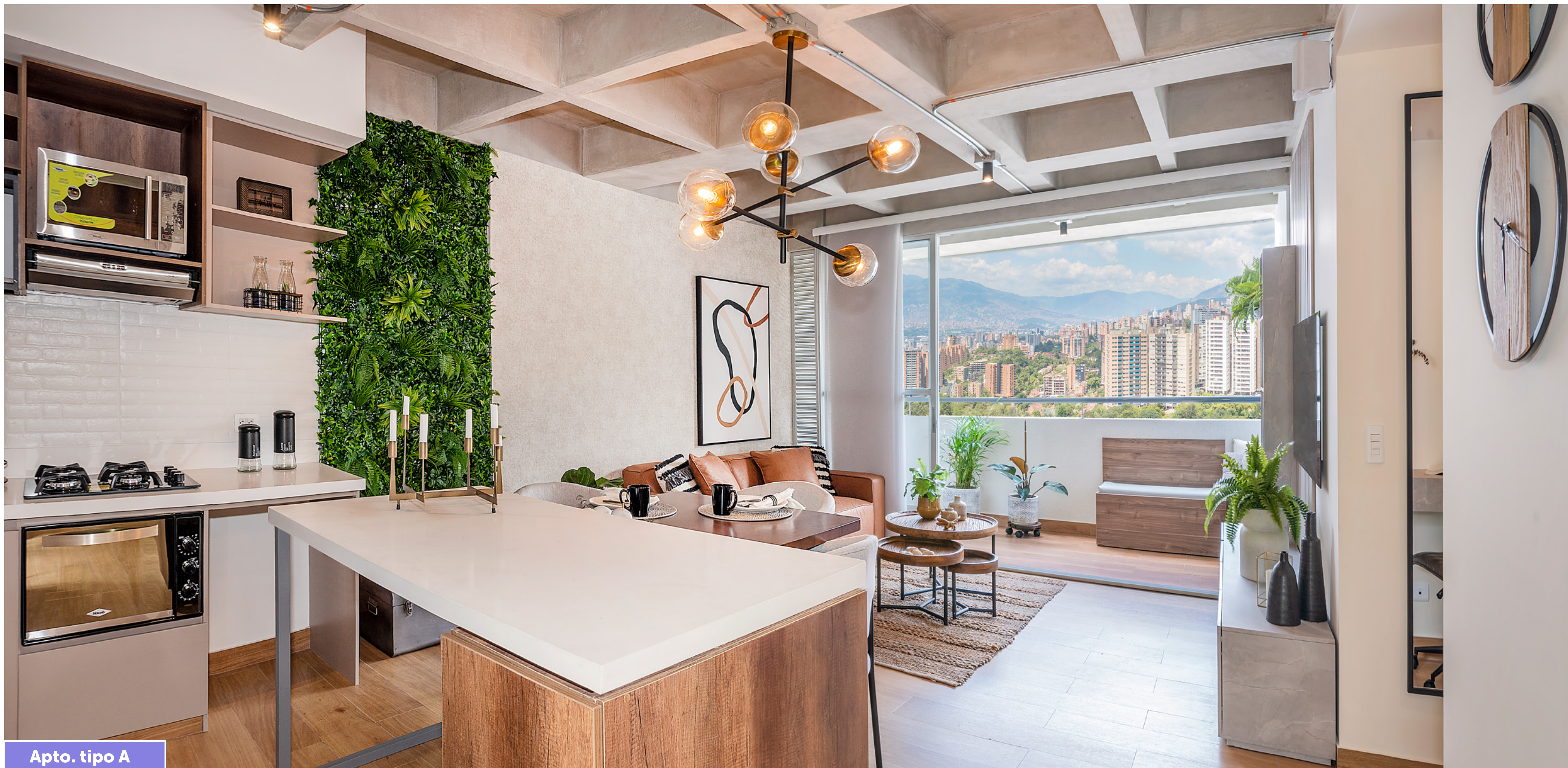
Apto. tipo A