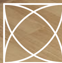
ILUSTRACIÓN SUJETA A CAMBIOS