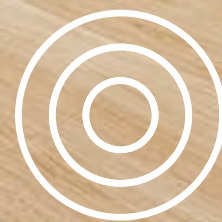
ILUSTRACIÓN SUJETA A CAMBIOS