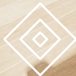
ILUSTRACIÓN SUJETA A CAMBIOS