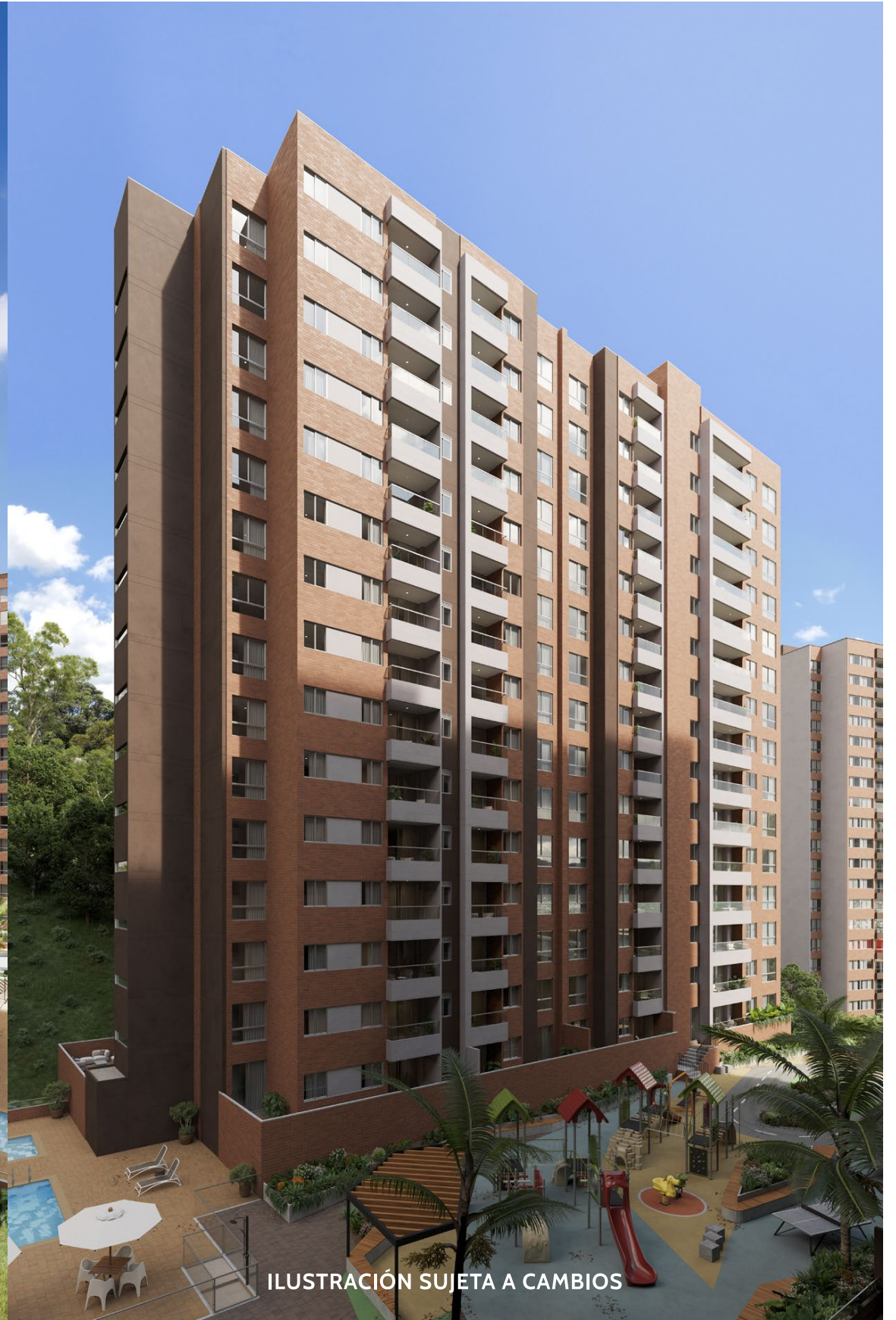
ILUSTRACIÓN SUJETA A CAMBIOS