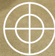
ILUSTRACIÓN SUJETA A CAMBIOS