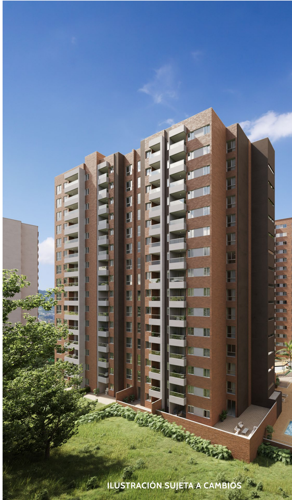
ILUSTRACIÓN SUJETA A CAMBIOS