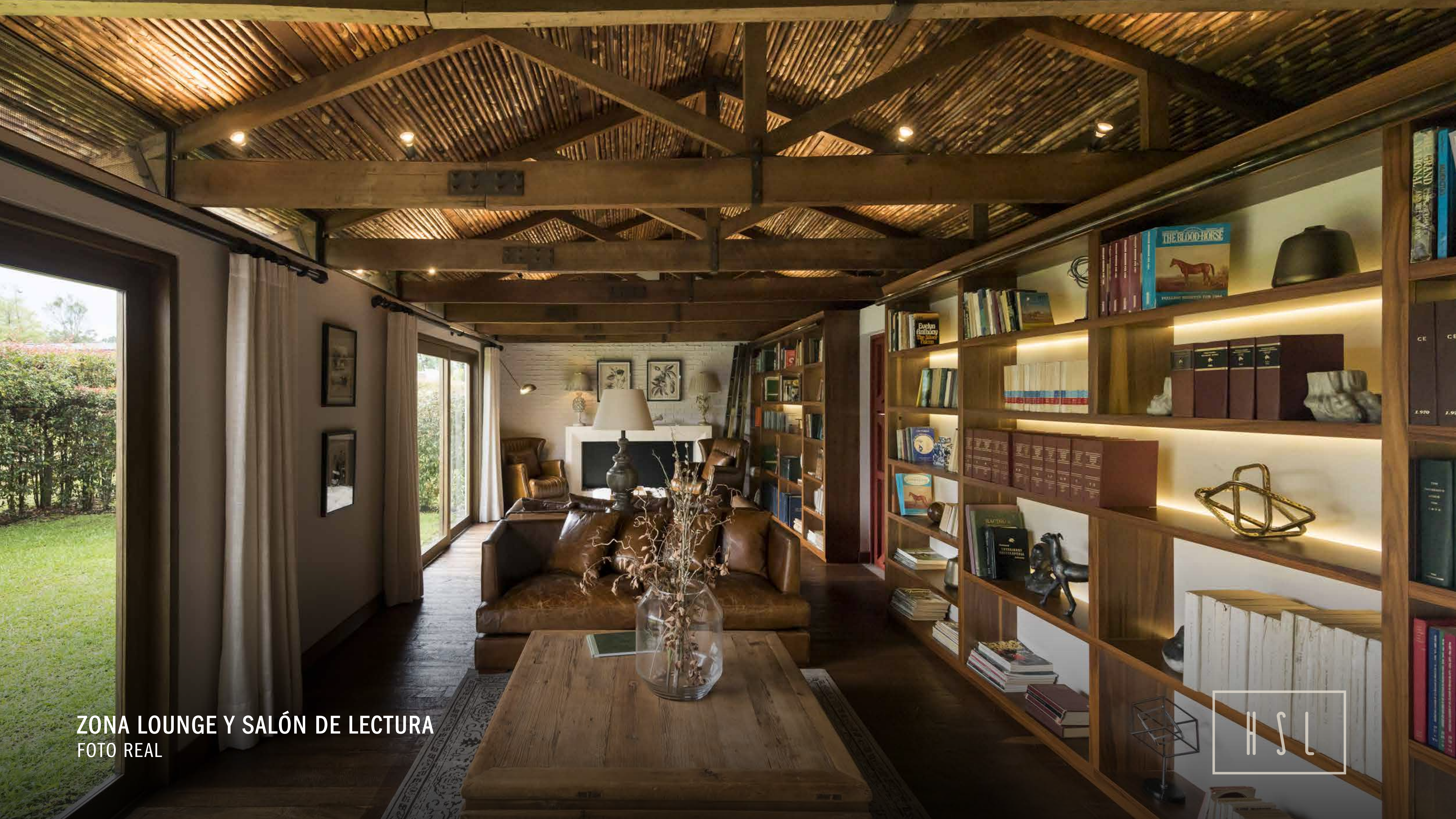
ZONA LOUNGE Y SALÓN DE LECTURA FOTO REAL