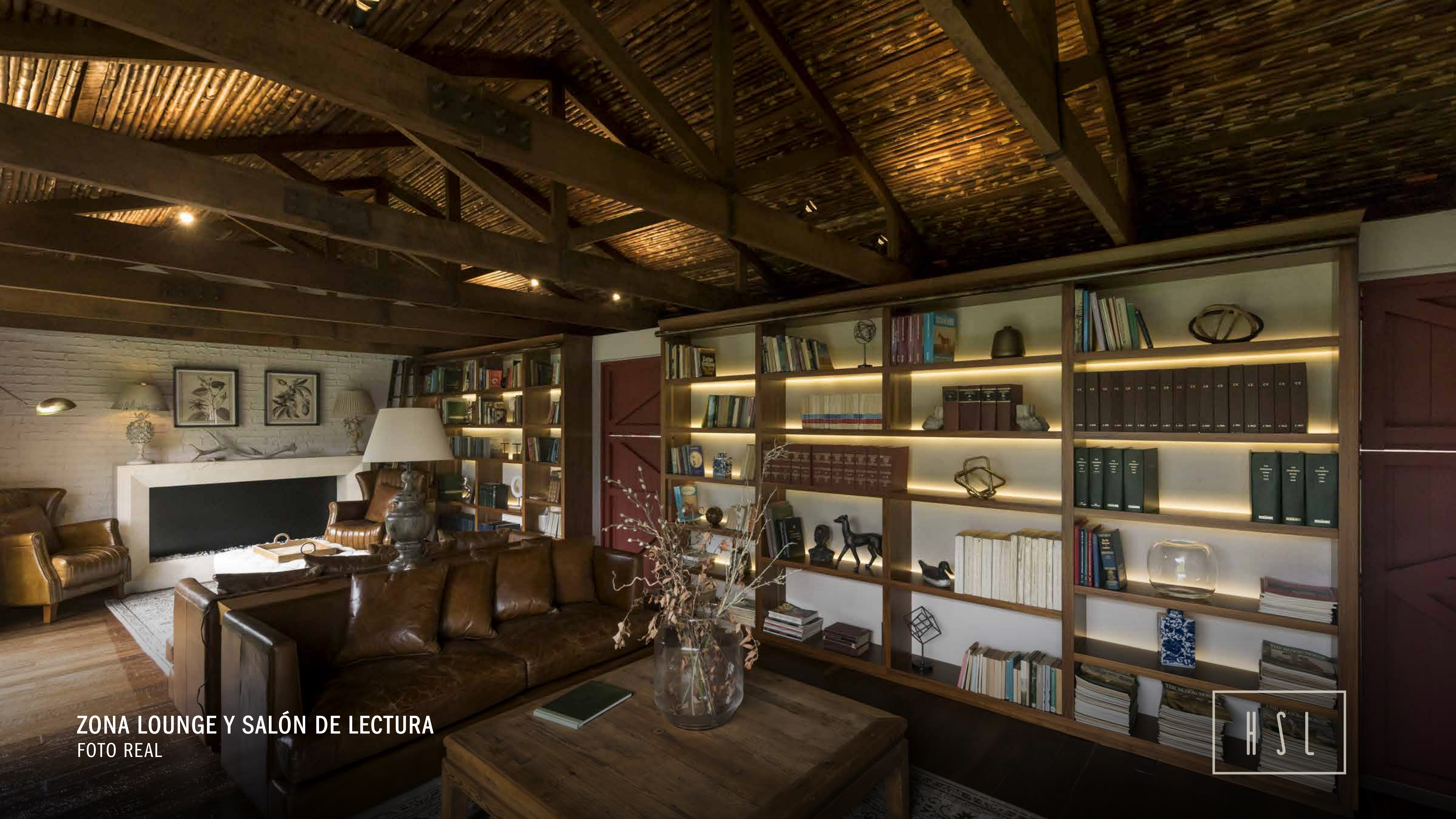
ZONA LOUNGE Y SALÓN DE LECTURA FOTO REAL